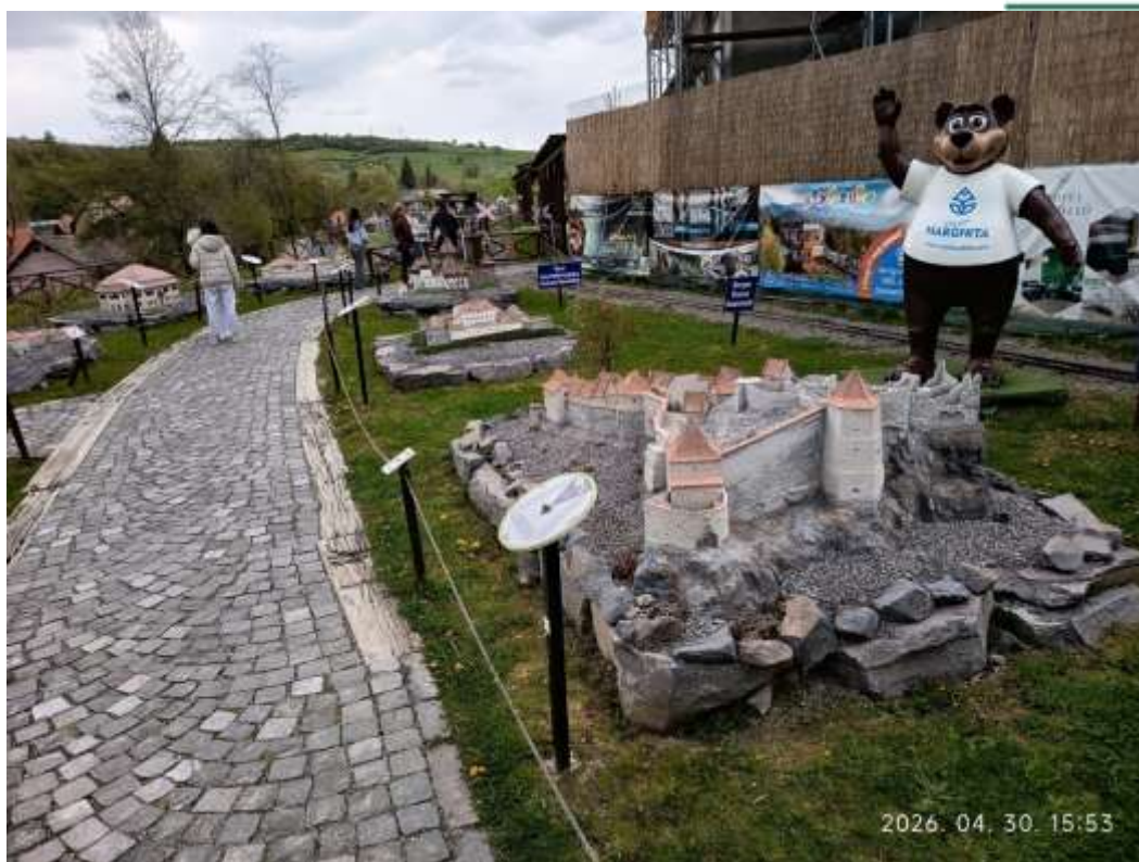
A Szelykefürdőn található Mini Erdély-parkban a helyi kastélyok, várak, templomok kicsinyített másait néztük meg.