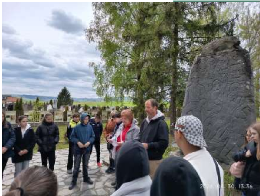
Farkaslakán Tamási Áron sírhelyének közelében a Trianon-emlékművet is meglátogattuk.