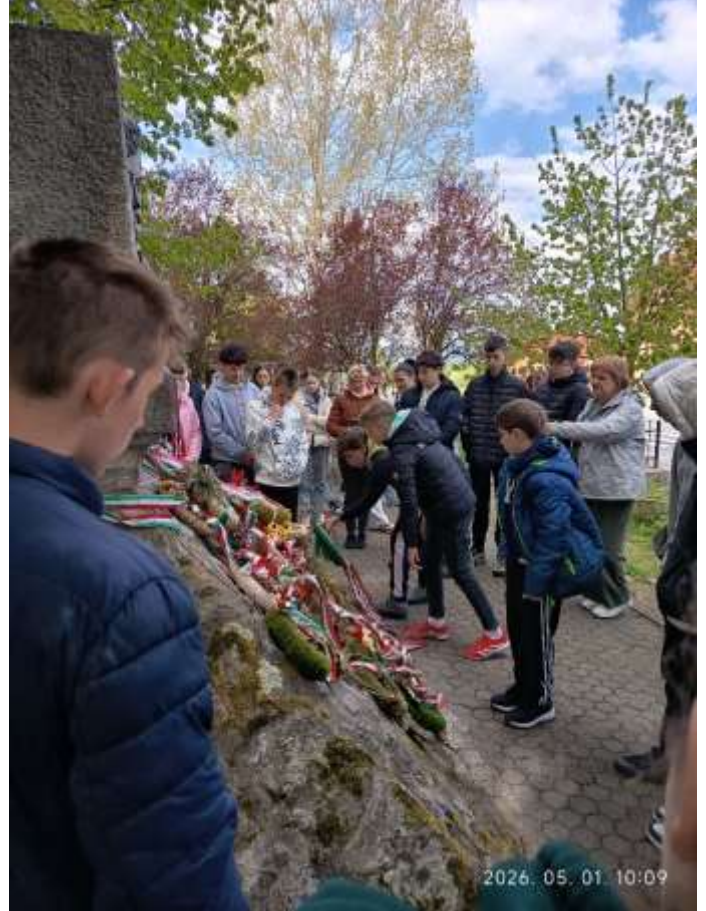
Fehéregyházánál megemlékezünk az 1849-es segesvári csatáról, koszorút helyeztünk el az emlékműnél.