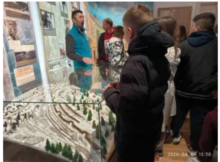
Csíkzépvízen felkerestük a Székely Határőr Emlékközpontot, ahol egy színvonalas történelmi tárlatot láttunk.