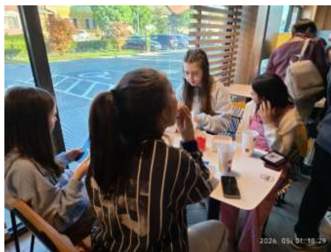
Hazafelé Makón bőségesen vacsoráztunk a McDonald's gyorsétteremben.