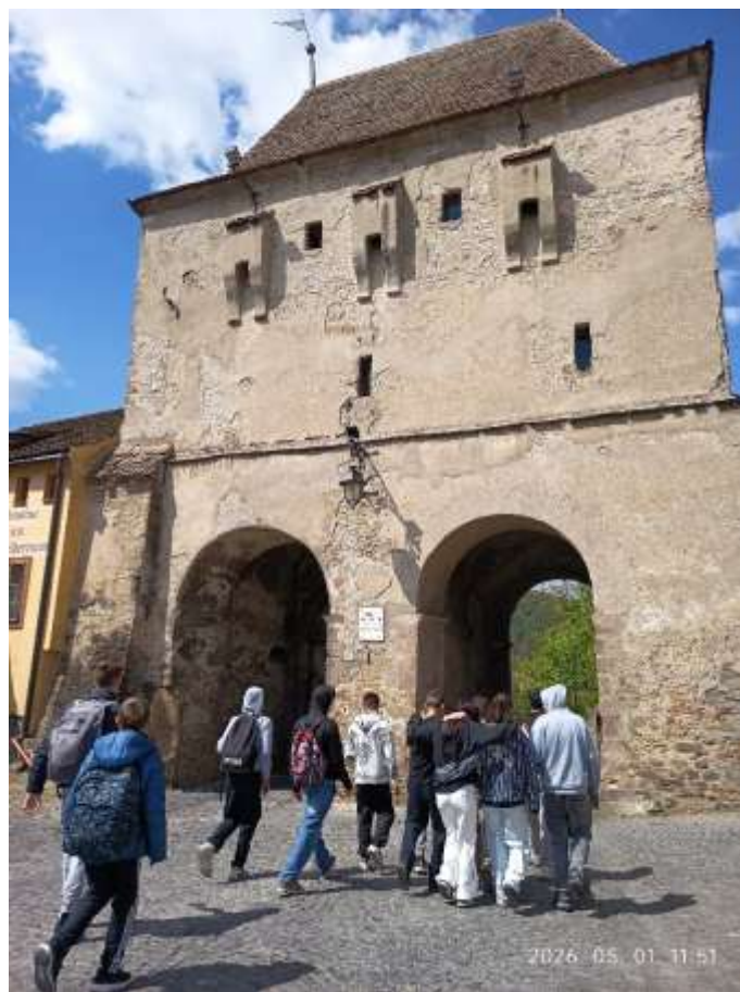
Segesváron felkerestük a középkori várat, a diáklépcsőn felmentünk az óratoronyba, és gyönyörködünk a város panorámájában.